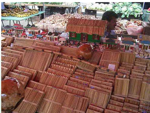
Kayamb, ein mit Körnern gefülltes Musikinstrument, zu dem man auf Réunion „Maloya“ tanzt

Aus dem Kolleg gingen internationale Tagungen und Summerschools unter anderem in Kooperationen mit dem Institut français, der Villa Ichon, der BIG und dem Hafenumuseum Bremen sowie etliche Publikationen hervor.