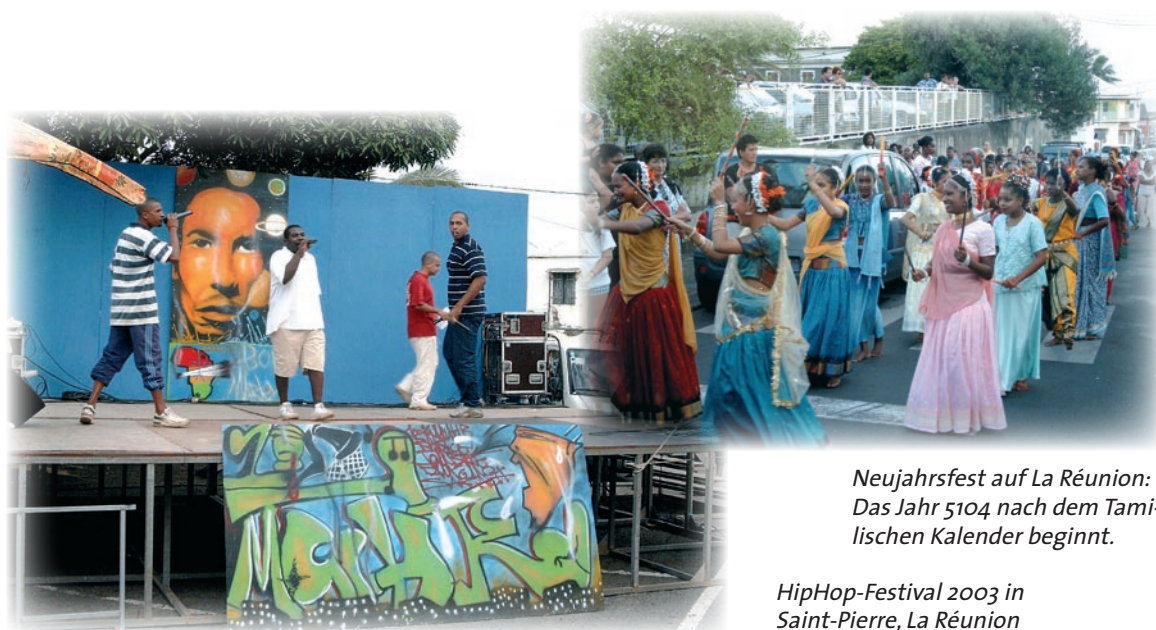
Neujahrsfest auf La Réunion: Das Jahr 5104 nach dem Tami- lischen Kalender beginnt.